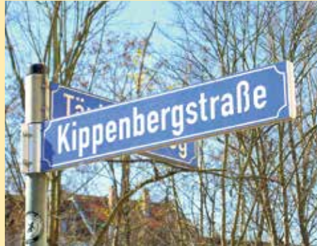
Kippenbergstraße in Reudnitz. Rechts: Band 278 der Insel-Bücherei, erschienen 1942. Im darauffolgenden Jahr wurde das Insel-Verlagshaus im Grafischen Viertel vollständig zerstört.

Geboren wurde Anton Kippenberg vor 150 Jahren am 22. Mai 1874 in Bremen. Nach einer Buch-