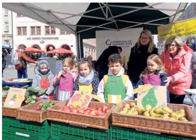
Mädchen und Jungen der Kita Tarostaße 9 als Markthändler.

Auch künftig wird so mancher Marktbesucher über Kinder als Markthändler staunen können, denn weitere 38 Verkaufstage sind geplant. Die Einnahmen aus dem Verkauf kommen den Kindern zugute. In den vergangenen Jahren