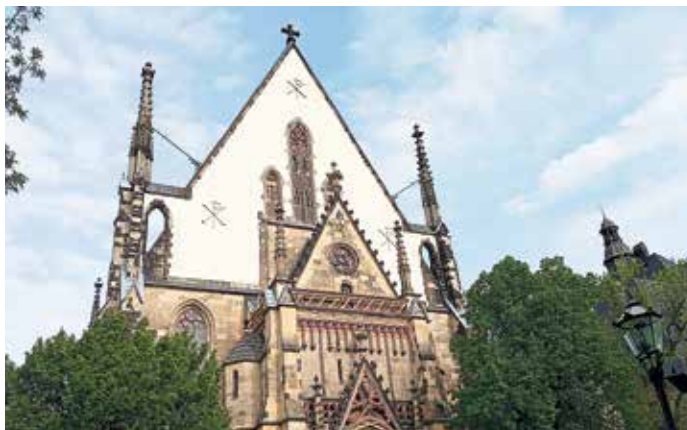
Thomaskirche zu Leipzig, Bachs Wirkungsstätte.

Die Monate Mai und Juni stecken voller kultureller Höhepunkte in Leipzig. Vom sächsischen Theatertreffen Ende Mai geht es über das Bachfest „Choral total“ Mitte Juni zum Ballettfestival Ende Juni. Zudem findet am 21. Juni wieder die „Fête de la musique“ in ganz Leipzig statt, und am 22. und 23. Juni wird die Wiese im Rosental erneut zum größten Konzertsaal der Stadt. Die Openair-Konzerte „Klassik airleben“ im Rosental bilden den krönenden Abschluss einer erfolgreichen Spielzeit des Leipziger Gewandhausorchesters.