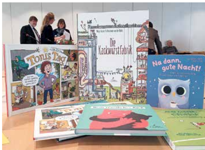
Titelauswahl von Klett Kinderbuch.