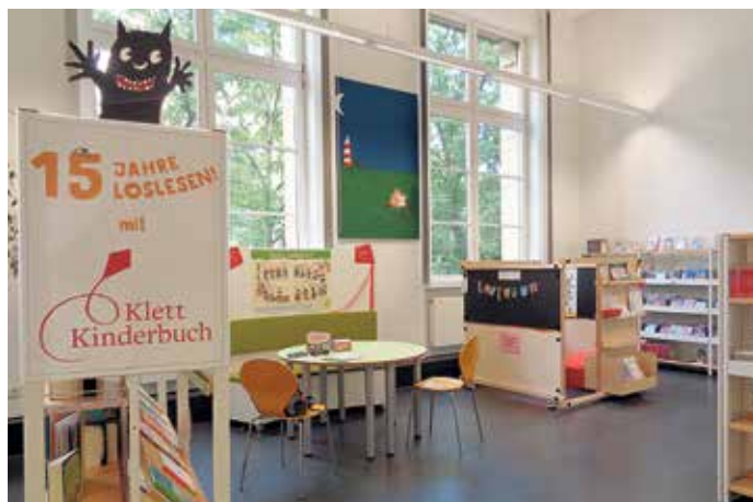
Die Ausstellung in der Kinderbibliothek am Leuschnerplatz.

Noch bis zum 1. Juni können Mädchen und Jungen mit ihren Eltern oder Großeltern in den ausgestellten Büchern schmökern. So lässt sich dort Bekanntschaft schließen mit den „Wilden Zwergen“, der „Böckchenbande“, mit „Rocco Randle“ und „Tonis Tag“ zum Beispiel. Auch in dem Bestseller „Die Kackwurstfabrik“ kann geblättert werden. Das Buch informiert witzig darüber, was mit dem Essen passiert, das wir schlucken, wie es weiter transportiert wird in den Magen und in den Darm, ehe der