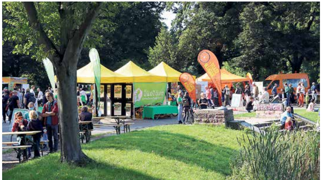
Buntes Treiben im Clara-Park.